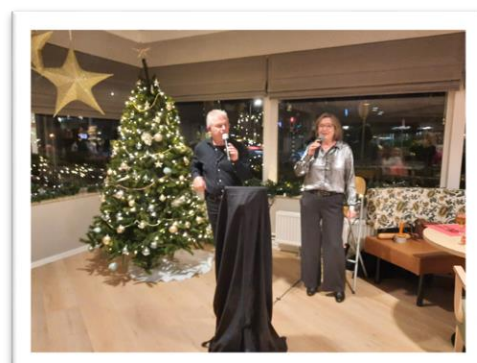
Kerstdiner in het restaurant