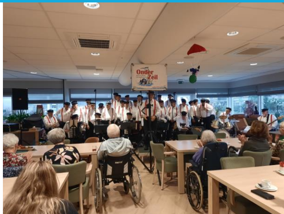
Koor Onderzeil, gezellig meezingen met bekende liedjes