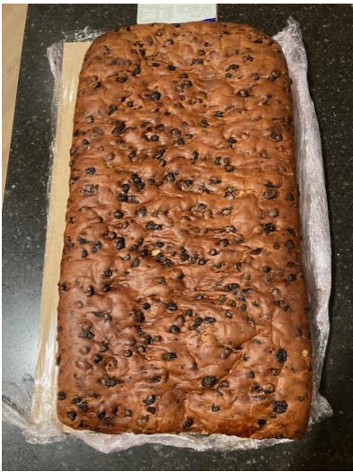
Kerstbrood geschonken Door vd Hoeven Plastics