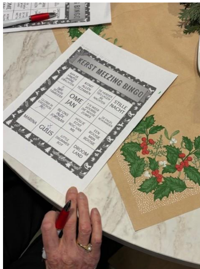
Kerst meezing bingo

Op FAMILIENED kunt u nog meer persoonlijke foto's zien van alle activiteiten. Via uw inlogcode kunt u inloggen bij dit programma.