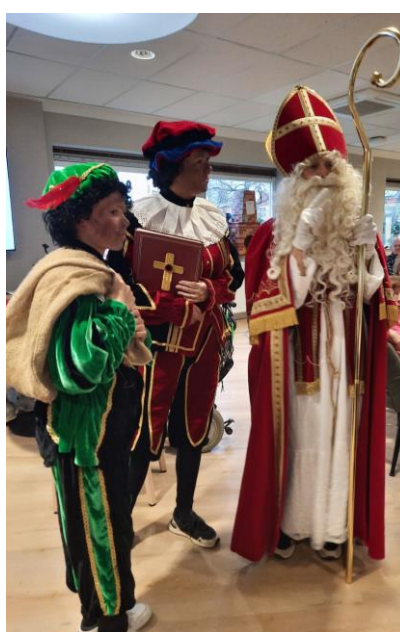
Sint, Piet en hulppiet op bezoek in de Ark