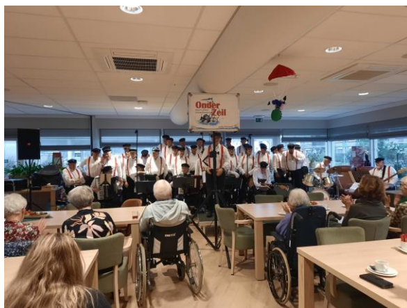
Koor Onderzeil, gezellig meezingen met bekende liedjes