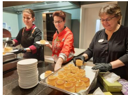
Kerstdiner in het restaurant