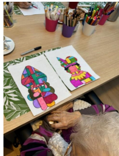
Er werd weer gezellig op kleur gekleurd!