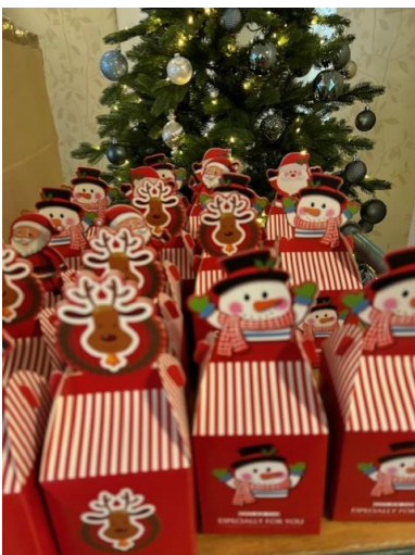
Kerstpresentje voor de bewoners van VBL