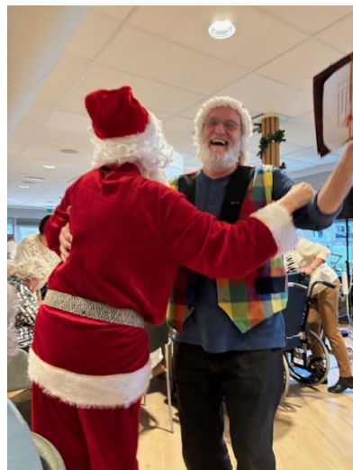
Kerst meezing bingo