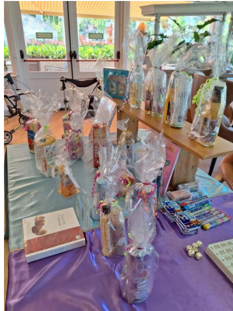
Bingomiddag in het restaurant