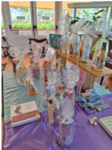
Bingomiddag in het restaurant