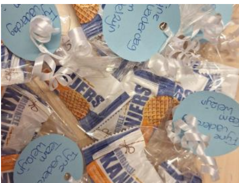
Verwennerij met Vaderdag

Deze zijn geschonken door Zyon uit Honselersdijk